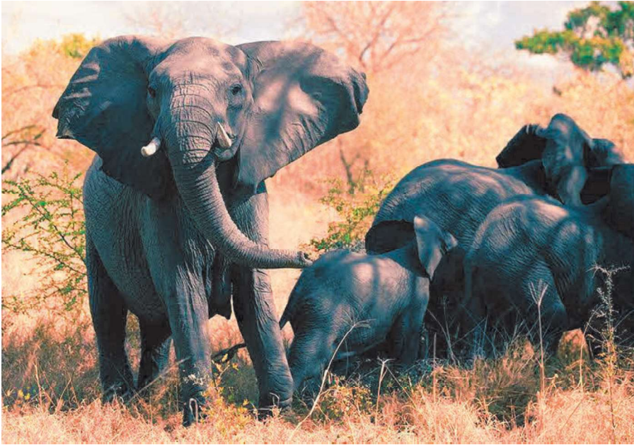
146. ábra. Csordáját védő, fenyegető elefánt magasra emelt fejjel, kitárt fülekkel az ormányát lóbálva.