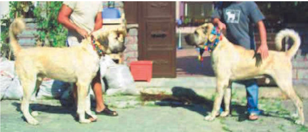
147. ábra. Domináns kanok pózolnak.

Nagyon szívesen bármikor oda állok a legjobb KÁJ vagy KAU kan mellé a saját kanjaimmal! Előre szólok, hátvonal fölé fog lendülni a farka a kutyáimnak, DE nem fognak meghátrálni!”