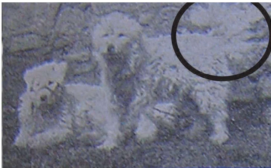
148. ábra. Komondor faroktartás az 1920-as években. Forrás: Raitsits Emil: Magyar kutyák (1924)