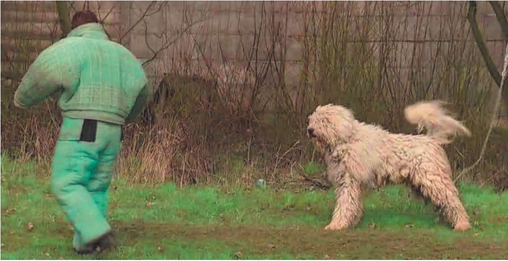
152. ábra. A franciabundás bátorságpróbákon jól szereplő komondorok mind emelik a farkukat.

Amint a korabeli felvételek mellett a leírásokból is látható, még a farkemelés két fő ellenzője, Buzzi és Raitsits is elismerték, hogy a komondorok többsége természetes módon emelte a farkát. Ennek ellenére ebben a kérdésben is az ő akaratuk érvényesült – már ami a szabályzatot illeti. A komondorok jelentős része ugyanis a mai napig sem akar tudomást venni erről a pusztítóan értelmetlen előírásról, és továbbra is rendületlenül emelik a farkukat.