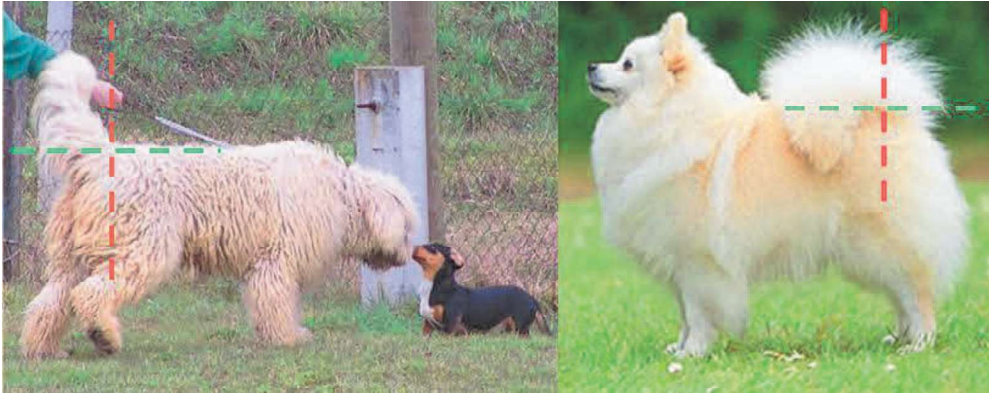
151. ábra. Természetes és normális, ám szabálytalannak minősített faroktartású komondor, és spicckre jellemző, pásztorkutyák esetében valóban nem ideális faroktartás.

Amennyiben Kerpely szavait úgy értelmezzük, hogy függőleges értelemben sem szabad a hát fölé kunkorodnia, akkor már ez a természetes faroktartás is szabálytalan – ahogy azt a mai napig értelmezzik.