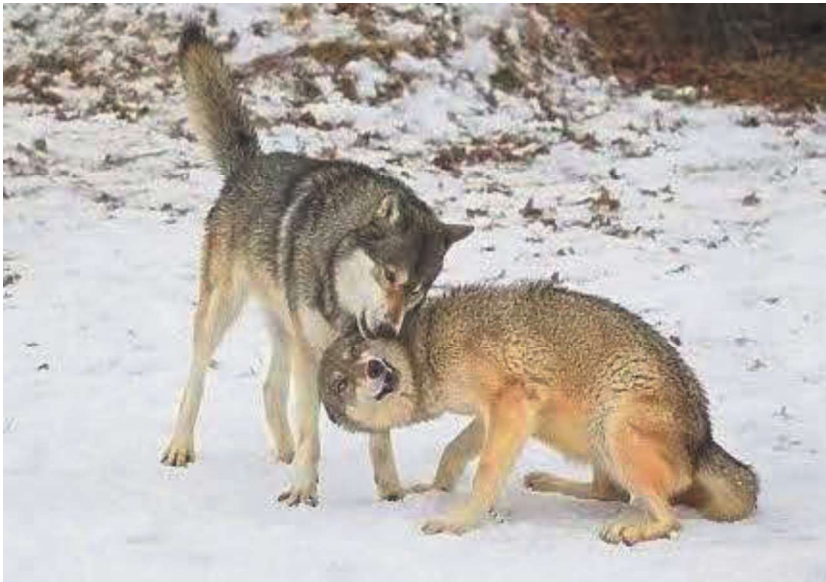
144. ábra. Domináns és alárendelt szürkefarkas interakciója.

A domináns állapot farokemeléssel történő kifejezése ugyanis nem csak a háziasított kutyára ( Canis lupus familiaris ), mint fajra jellemző, hanem a kutyafélék családjának több más fájára is, mint pl. a különböző vadkutya fajokra, vagy farkasokra.