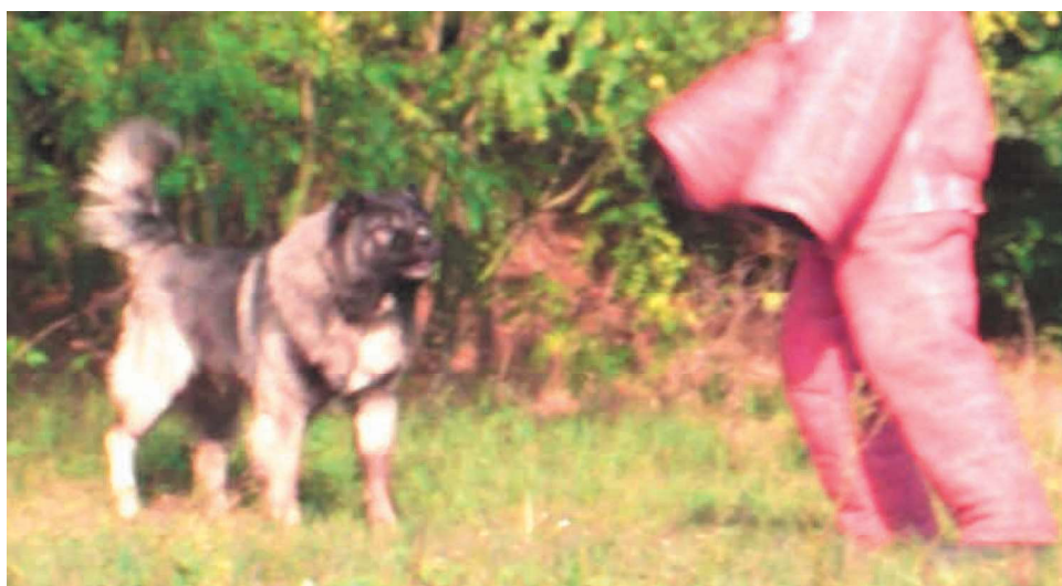
145. ábra. Franciabundás segéddel határozottan, domináns pózban szembe álló kutya.