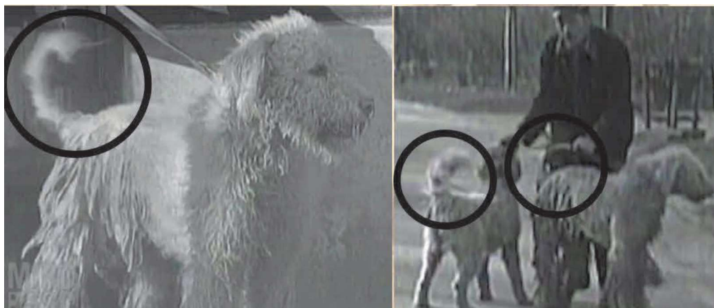
149. ábra. Komondorok faroktartása 1929-ben.

Ha 100-150, és közel 200 évvel ezelőtt is tulajdonképpen mindenki úgy írta le a komondort, hogy bizony emelik a farkukat, akkor vajon honnan ered az a képtelenség, hogy ezt a standard hibának írja le???